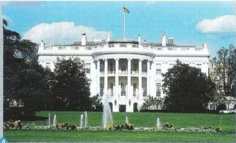
A La Maison Blanche, siège de la présidence (Washington).

6) Quels pouvoirs sont concentrés dans la Mégalopolis ?