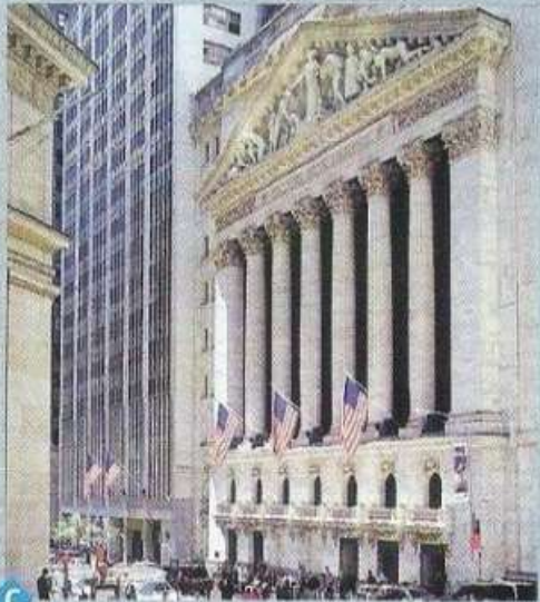
C Wall Street, première bourse de la planète (New York)