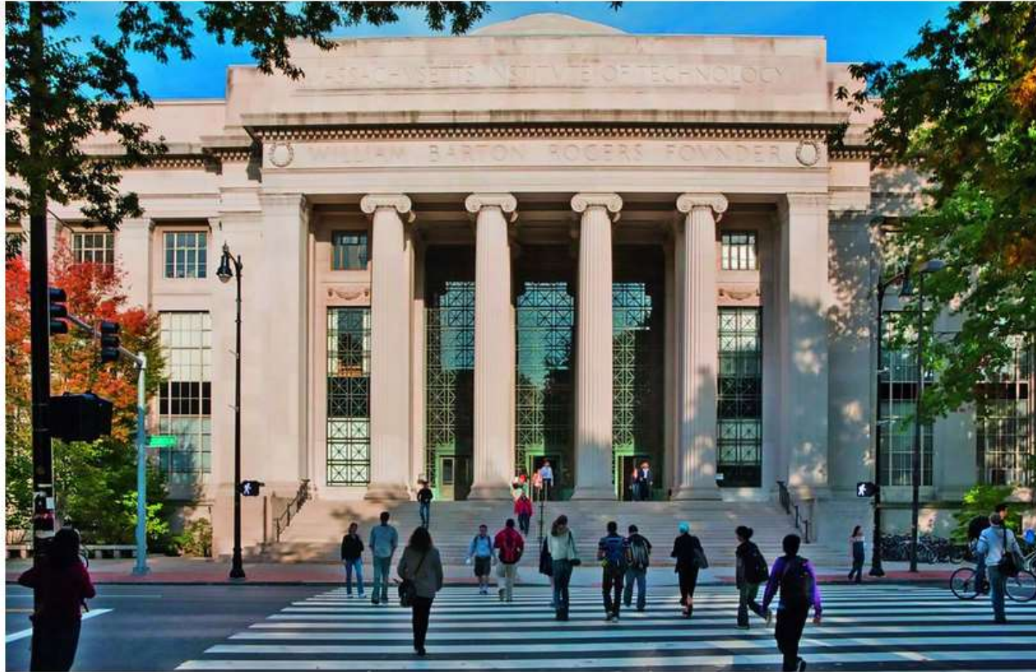
© Belin Éducation/Humensis, 2019 Géographie, 1re, 2019

5) Pourquoi les universités sont-elles un facteur de mondialisation ?