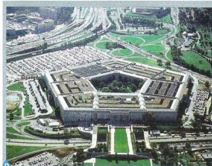
D Le Pentagone, quartier général de l'armée (Washington)