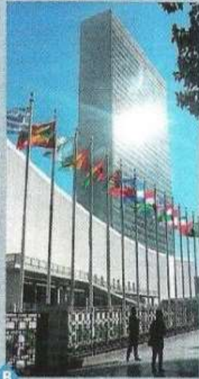
B Le siège des Nations unies (New York)