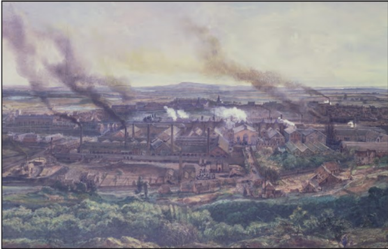
Tableau d'Ignace Francois Bonhommé, Conservatoire National des Arts et Metiers