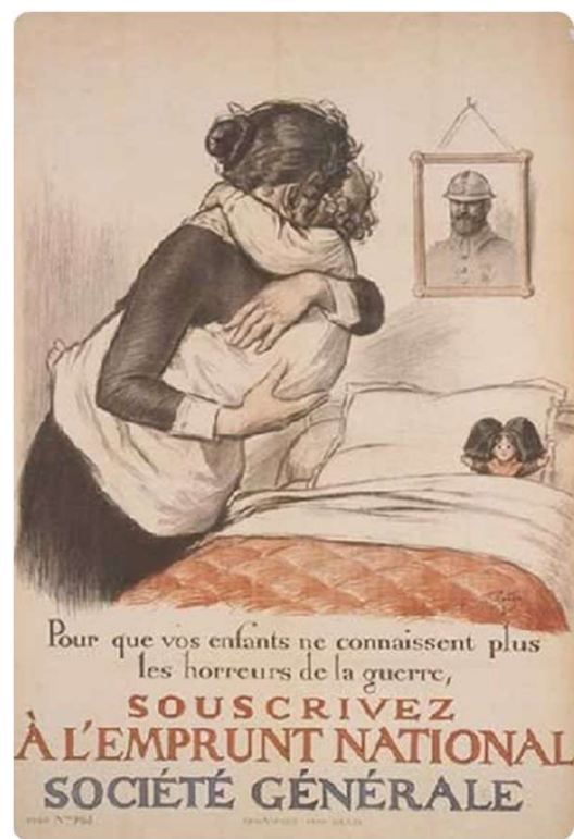
Affiche française 1917